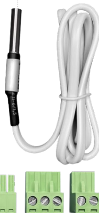
клеммники (питание, реле)