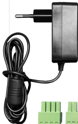
клеммники (подключение к OpenTherm и выносной панели)