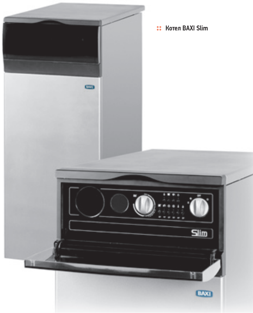
Котел BAXI Slim

тованная уникальная конструкция состоит из секций, собираемых при помощи стальных гидравлических коллекторов. Такая компоновка теплообменника дает ряд неоспоримых преимуществ по сравнению с классической ниппельной сборкой, например: низкое гидравлическое сопротивление полости теплообменника и компактный размер теплообменника. При этом для сборки используется всего один гаечный ключ. Секционный теплообменник из высокопластичного эвтекти-