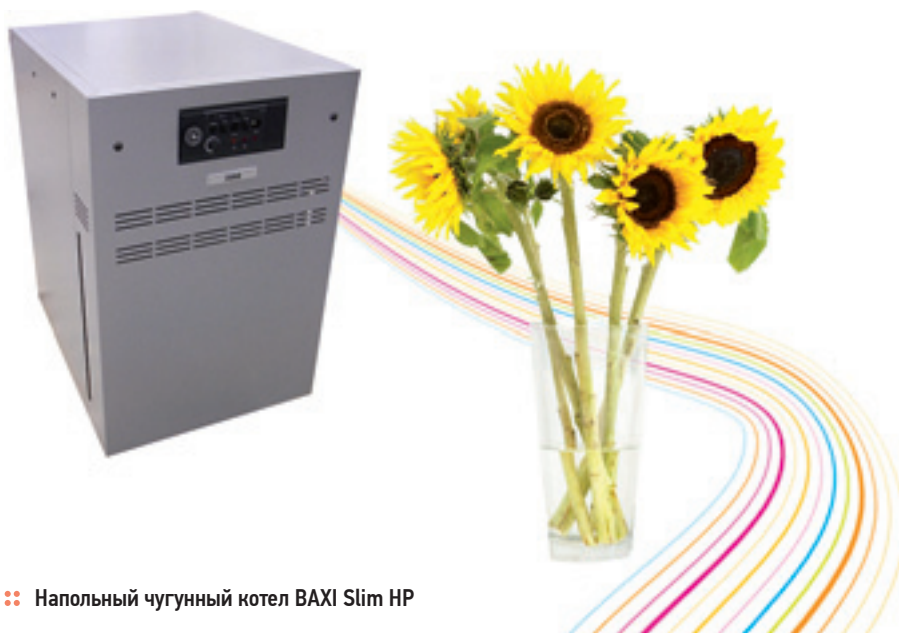
❖ Напольный чугунный котел BAXI Slim HP

ческого чугуна с профильными ребрами имеет большую поверхность теплообмена и отличные аэродинамические свойства.