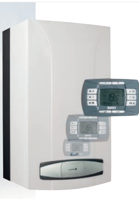
Котел BAXI Luna3 Comfort с выносной панелью управления